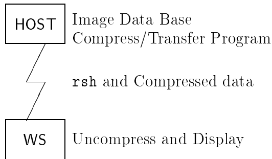
図 3: rsh を用いた圧縮データの伝送